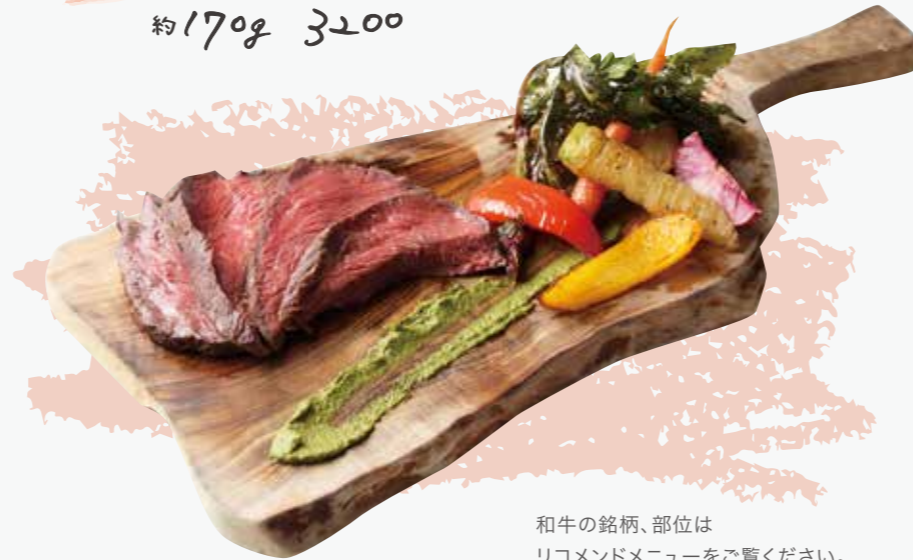
和牛の銘柄、部位は リコメンドメニューをご覧ください。